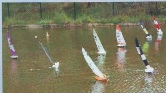
A l'extérieur, une régates sur le plan d'eau, ambiance compétition !.