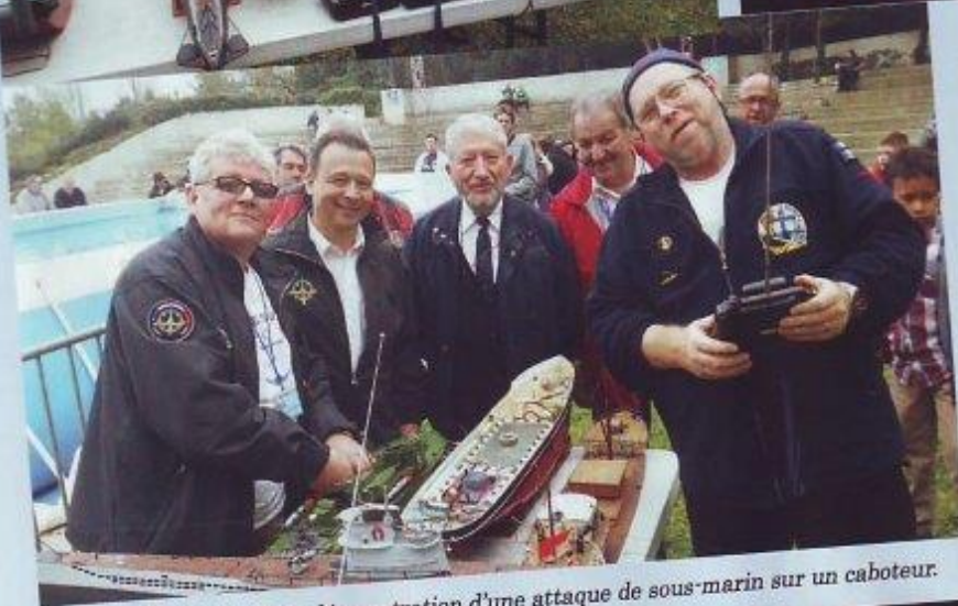
L'équipe de choc avant la démonstration d'une attaque de sous-marin sur un caboteur.

Riva, de voile moderne, de vieux gréements, de bateaux originaux ou plus classiques... ils ont tous, chacun à leur manière, apporté bonne humeur et ambiance sur le salon, durant ces deux jours.