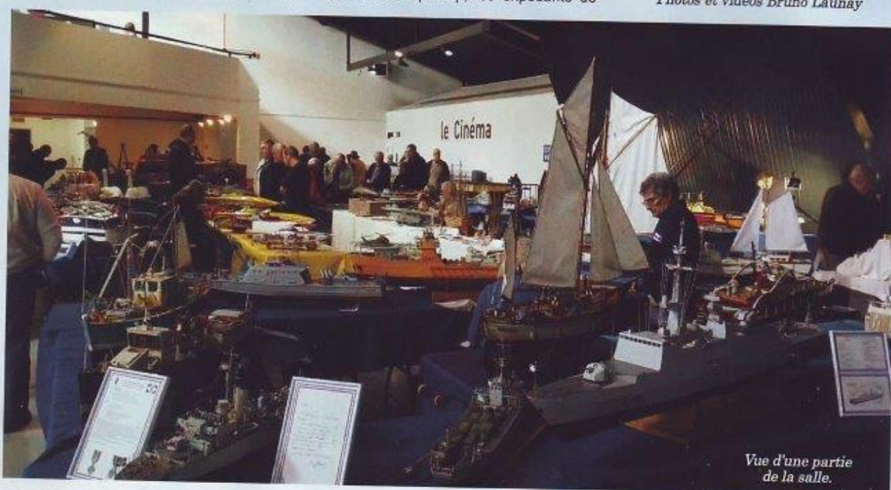
Vue d'une partie de la salle.