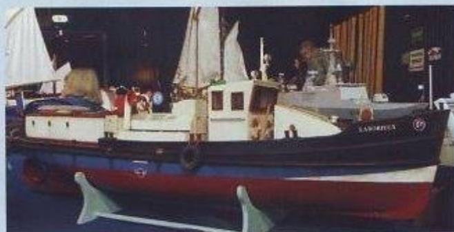
Le Laborieux; plan Bateau modèle.